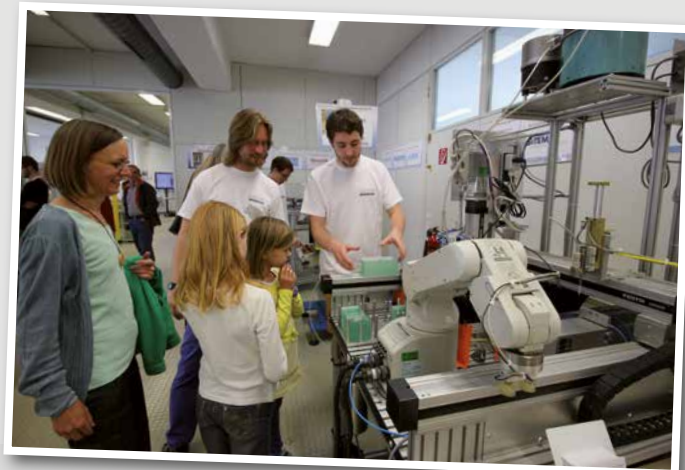
Firmen und die Hochschule haben geöffnet.

3D-Druck, Roboter, Elektromobilität, Radioteleskop, Rennwagen – und vieles mehr: Die Institute und Labore der Hochschule haben geöffnet und man kann sich unter anderem aktuelle Forschungsprojekte anschauen. Der Campus Göppingen der Hochschule Esslingen hat